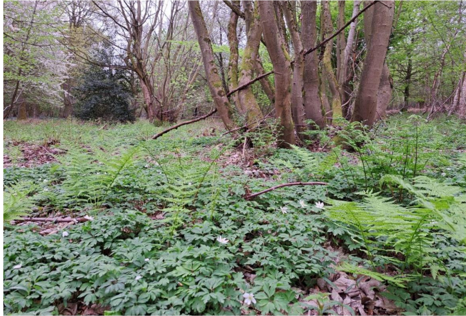
Figuur 4: Oude hakhoutstoof van gewone esdoorn met een ondergroei van bosanemoon.