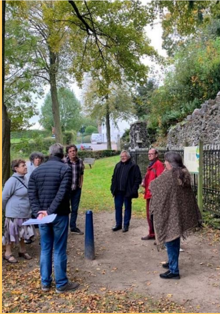
Werkgroep, Kern met Pit